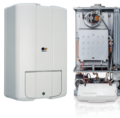
Mod. AURA RSER 27/H CE

A richiesta: sistema di controllo remoto a distanza e sonda esterna per regolazione climatica