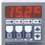
Controllo Digitale PAN 1